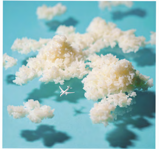
ハブ ア ライス トリップ!