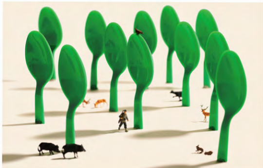
ハングリーハンター