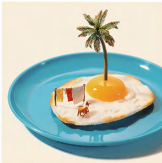
マミーサイドアップ