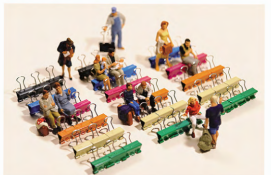
しばらくここで待ってクリップ