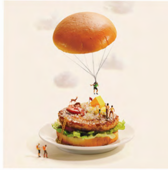
ハンバーガーパラシュート